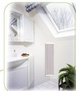
22°C dans la salle de bain