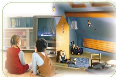
16°C/18°C dans la chambre

Pour des températures idéales, réglez votre thermostat à :